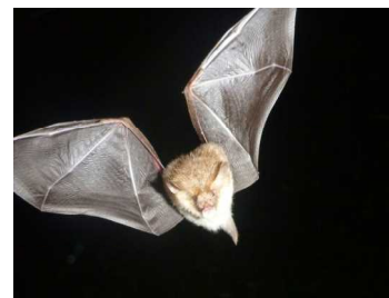
コテングコウモリ

秩父などで観察されている県の絶滅危惧種 モニタリング1000調査で確認されたもの