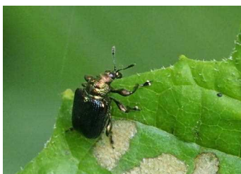
カシムリオトシブミ

葉を巻いて卵を産み付けて切り落とす「落とし文」を作る甲虫の仲間 カシノ葉以外も巻く