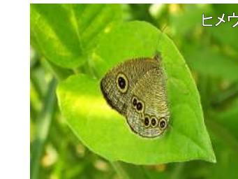
ヒメウラナミジャノメ